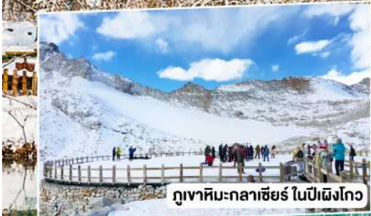
ภูเขาหิมะกลาซีร์ ในปีผิงโกว