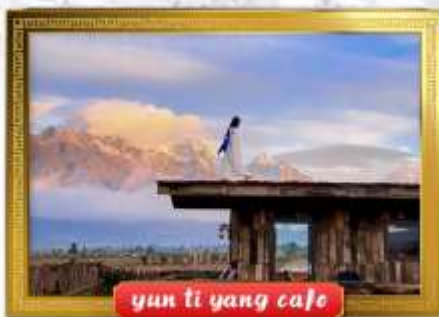
yun ti yang cafe