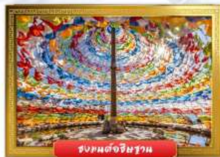
ชมพรจุดรงบนต้อริชฐาน