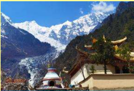
ธารน้ำแข็ง หมิงหย่ง