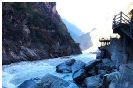
ช่องแคบเลือกระโจน

พักที่ DEQING HOTEL ระดับ 4 ดาวท้องถิ่นหรือเทียบเท่าในเมืองเต๋อชิง