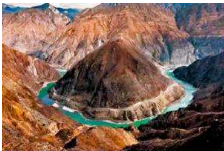
โค้งแรกของแม่น้ำจินซาเคียว

พักที่ PHOENIX HOTEL โรงแรมระดับ 4 ดาวท้องถิ่น หรือเทียบเท่าในเมืองเซงกรีล่า