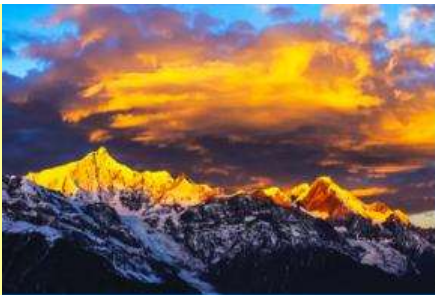
ภูเขาหิมะเหม่ยหลี่

หลังอาหารนำท่านเข้าสู่โรงแรมที่พักในเมืองเต๋อชิง ให้ท่านพักผ่อนหรือเดินเล่นถ่ายภาพในเมืองตามอัธยาศัย