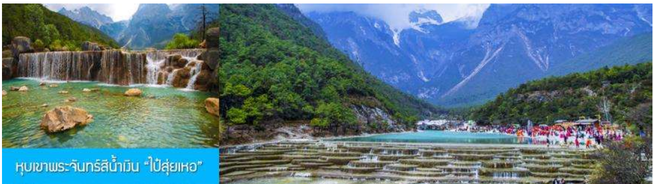
หุบเขาพระจันทร์สีน้ำเงิน “ไป๋ส่วยเหอ”

เมื่อคณะโดยสารกระเช้าลงจากภูเขหิมะมังกรหยก