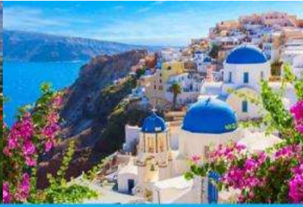
ย่านซานโตรินี่