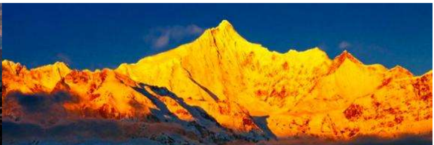
จุดชมวิว ภูเขาหิมะ