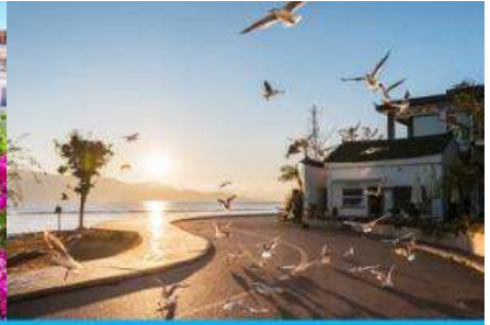
ย่านชายหาดรูป S