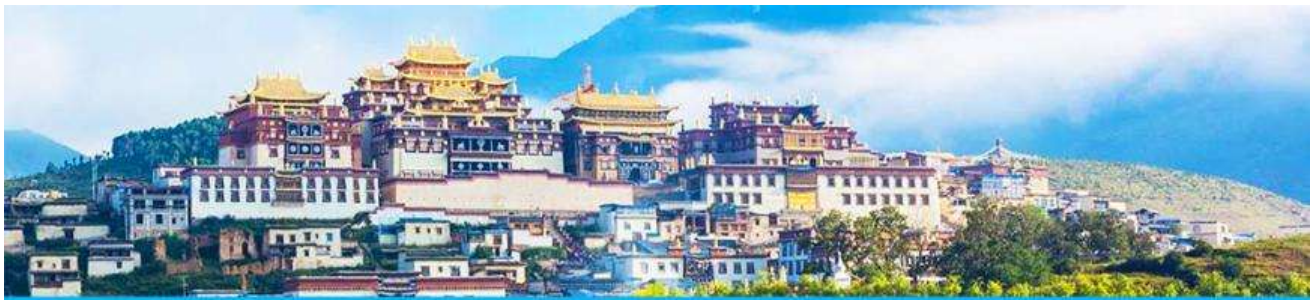
เมืองโบราณเซงกรีล่า