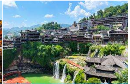
เมืองโบราณผู่หลงเจี้ยน