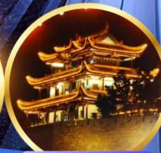
หอคอยทองคำเทียนชาน