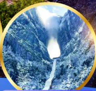
ประติมากรรม หิมะเหมินชาน