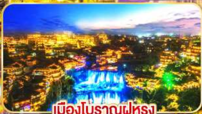
เมืองโบราณฟูหลง