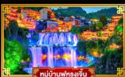
หมู่บ้านฟูหลงเจิ้น