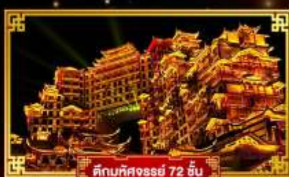
ตึกมหิศจรรย์ 72 ชั้น