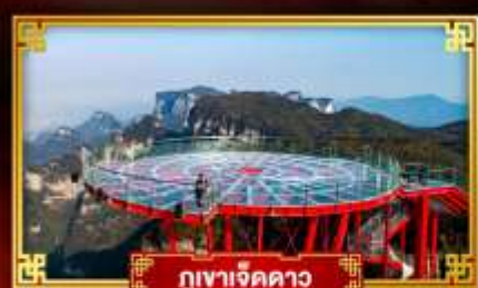
ภูเขาเจ็ดดาว