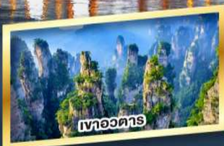
เขาอวดาร