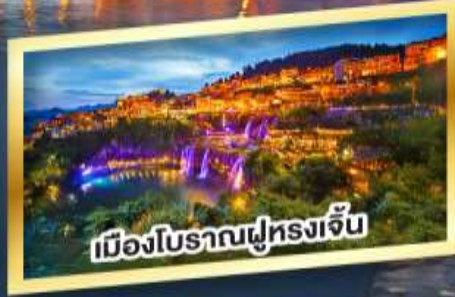
เมืองโบราณฝูหลงเจิน