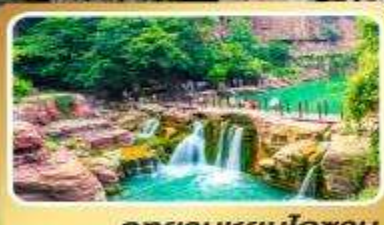
อุทยานหยุ่นโกซัน