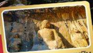
ผาแกะสลักหลงเหมิน