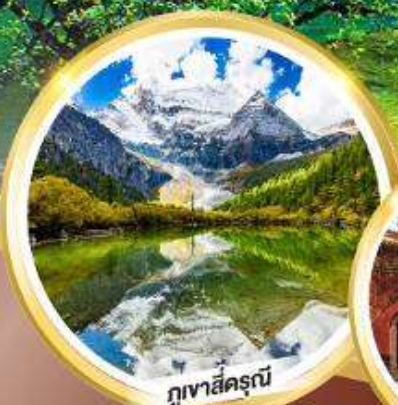
ภูเขาสีดรุณี