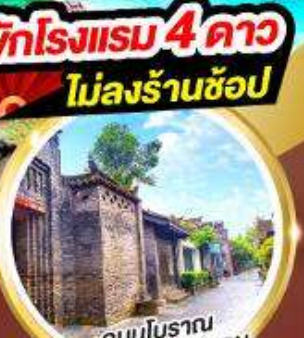
ถนนโบราณ ซอยกว้างชอยแคบ