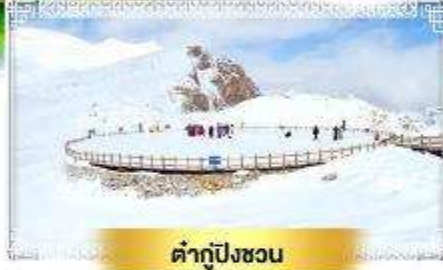
ต้ากู่ปิงชวอ