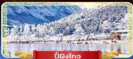
ปี้ดิงโกว

สัมปัสสวรรค์บนดินแห่งเมืองจีน เที่ยวสุดคุ้ม 3 อุทยานทางธรรมชาติ