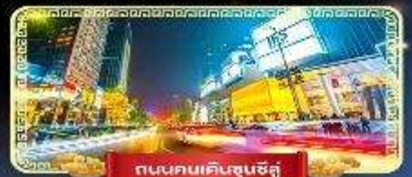
ถนนคนเดินชุนชิว