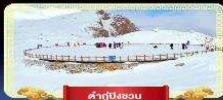
คำกู่ปิงชอน