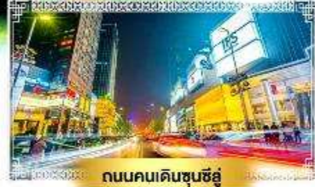
ถนนคนเดินชุนซีอู่