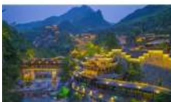
หุ่นเขาเทวดาวิ่งเซียนทู่