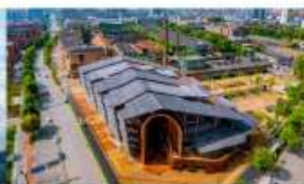
ลานวัฒนธรรมเทาซีชว่น