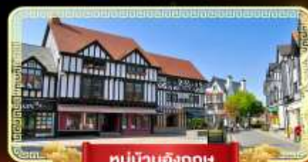
หมู่บ้านอังกฤษ