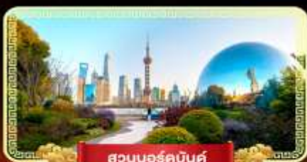
สวนนอร์คบันด์