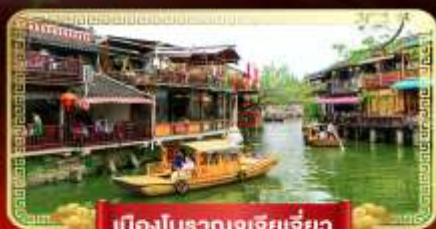
เมืองโบราณจูเจียเจี้ยว