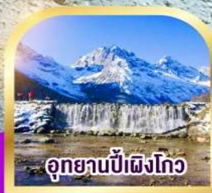
อุทยานน้ำตกริมโกว