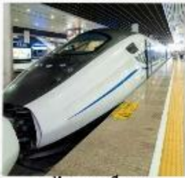
รถไฟความเร็วสูง สู่จิวจ้ายโกว