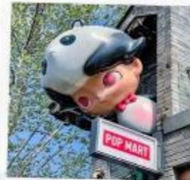
ชอยกวางแดบ