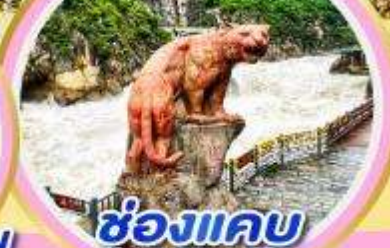
ช่องแคบ เสือกระโจน