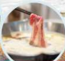
เมนูพิเศษ สุกี้หม่าล่า