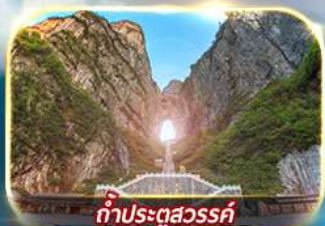
ท่าประตูลั่ว