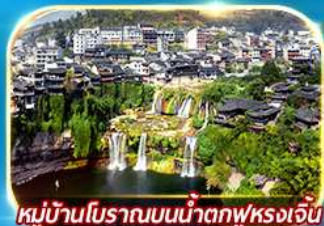
หมู่บ้านโบราณบนน้ำตกฟุรงเจิน