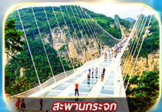
สะพานกระจก