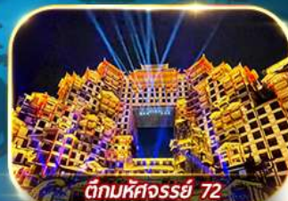
ตึกมหัศจรรย์ 72

เต็มอิ่มกับบรรยากาศเมืองโบราณเฟิ่งหวง เขาเทียนเหมินซาน ประตูลั่ว หมู่บ้านโบราณบนน้ำตกฟุรง