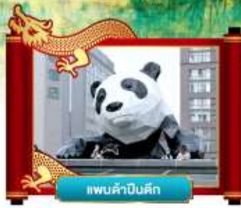
แพนดำเซลฟี