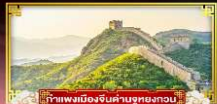
กำแพงเมืองจีนด่านชูหยงกวน

“ตะลุยสวนสนุกยูนิเวอร์แซล” ชมสิ่งมหัศจรรย์ของโลกกำแพงเมืองจีน