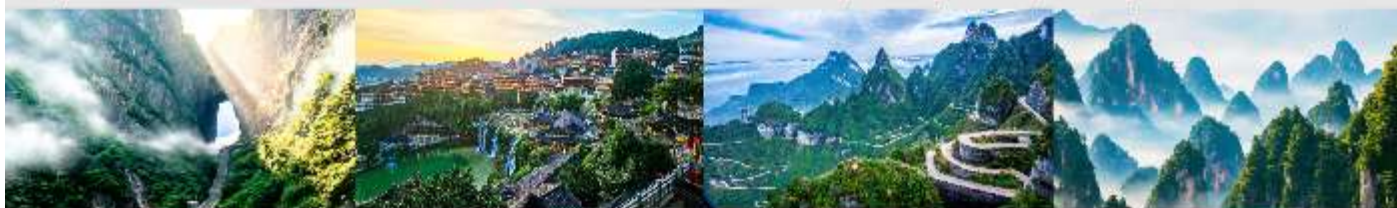
ประตูลั่ว