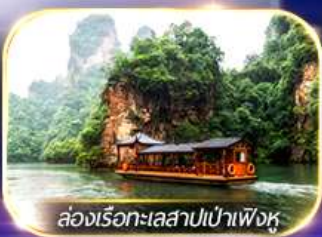
ล่องเรือทะเลสาบเป่าเฟิงหู