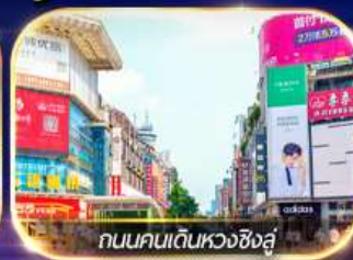
ถนนคนเดินหวงซิงสู

ล่องเรือชมเมืองโบราณ ฟุรงเจิน + ทะเลสาบเป่าเฟิงหู