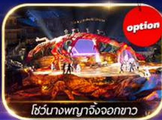
โชว์นางพญาจิ้งจอกขาว