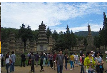
ป่าเจดีย์