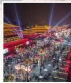
ถนนคนเดิน วัฒนธรรมต้าถิง