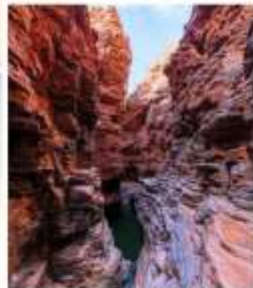
แกรนด์แคนยอนยูลาโกว