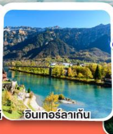
อินเทอร์ลาเก็น