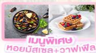
เมนูพิเศษ หอยมัสเซล+วาฟเฟิล