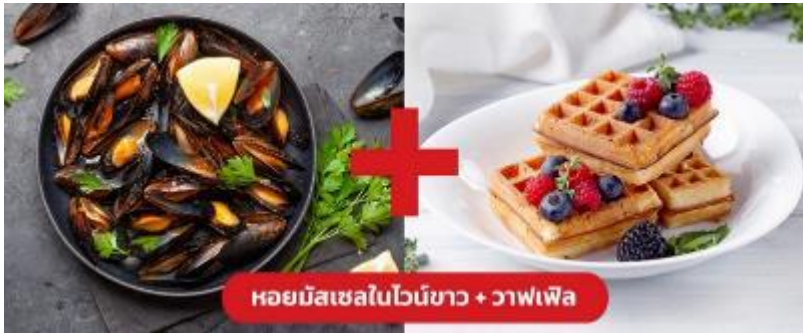
หอยมัสเซลไวน์ขาว + วาฟเฟิล

เย็น 🍷 รับประทานอาหารเย็น (มือที่10) เมนูพิเศษ!! หอยมัสเซล + วาฟเฟิล (Mussel in White wine + Waffle)