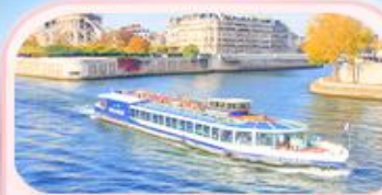
คลองเรือแม่น้ำเซน