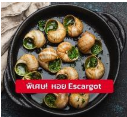
พิเศษ! หอย Escargot

เย็น 🍷 รับประทานอาหารเย็น (มื้อที่12) เมนูพิเศษ!! หอยเอสคาโก้ (Escargot)