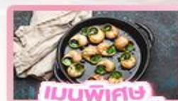
เมนูพิเศษ หอยออสตาโก้

เยอรมัน เนเธอร์แลนด์ เบลเยียม ฝรั่งเศส Keukenhof