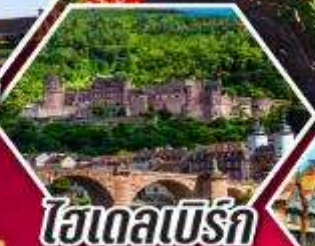
ไฮเดลเบิร์ก