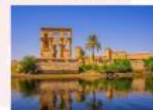
วิหารฟิเล

16.25 น. ออกเดินทางสู่กรุงไคโร สายการบิน Egypt Airlines เที่ยวบิน MS295