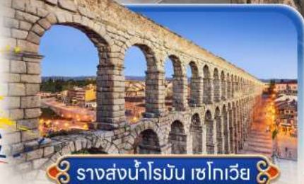
รางส่งน้ำโรมัน เซโกเวีย

สายการบินสัญชาติสเปน ✕ บินตรง Full Service