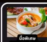
มือพิเศษ อาหารไทยในยุโรป