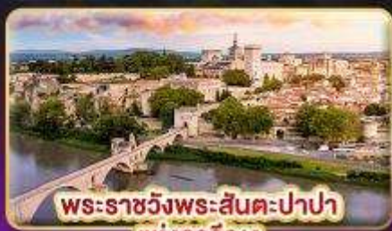
พระราชวังพระสันตะปาปา แห่งอวีญง