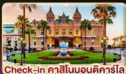
Check-in คาสีโนมอนติคาร์โล