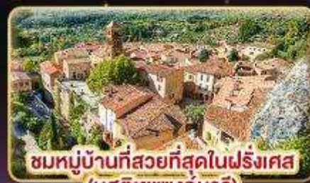
ชมหมู่บ้านที่สวยงามที่สุดในฝรั่งเศส (มูสติเยแซงก์มารี)