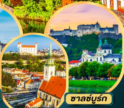
บราติสลาว่า