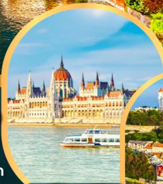
ส่องเรือแม่น้ำดานูบ