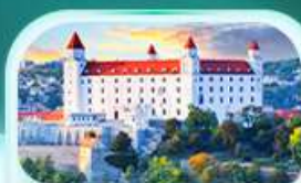
ปราสาทปราตีสลวา

เที่ยวชมเมืองอัลสตัดท์ หมู่บ้านริบะทะเลสาบสวยที่สุดในโลก พระราชวังเซินบรุนน์ เมืองลินซ์ จิตรกรรมฝาผนังยักษ์ สัมผัสเมืองมรดกโลก เซสท์ ครุมลอฟ เยี่ยมชมปราสาทปราก ถนนทองคำ เข็ดอั้นสถานที่ชื่อดัง! ปราสาทปราตีสลวา ล่องเรือชมความงามแม่น้ำดานูบ แม่น้ำที่ยาวที่สุดในยุโรป ชมความน่าหลงใหลของ ปราสาทบูคาเปสต์ สะพานชาร์ลส์