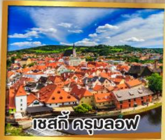
เซสท์ครุมลอฟ