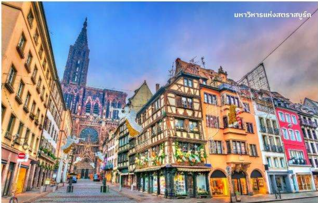
มหาวิหารแห่งสตราสบูร์ก

นำท่านเที่ยวชม จัตุรัสเทลแบร์ เป็นจัตุรัสที่มีขนาดใหญ่ที่สุด โดยภายในจัตุรัสยังเป็นที่ตั้งของ รูปปั้น ซ็อง แม็บติสต์ เทลแบร์ ผู้ที่มีบทบาทสำคัญในเรื่องสงครามการปฏิวัติของประเทศฝรั่งเศส นำท่านถ่ายรูป มหาวิหารแห่งสตราสบูร์ก มีความสูงอยู่ที่ 142 เมตร ซึ่งถูกสร้างขึ้นระหว่างปี 1176 ถึง 1439 ที่สร้างด้วยหินทรายสีชมพูดูงามระหงโดดเด่นเห็นแต่ไกลและถือว่าเป็นอาคารโบสถ์ที่สูงที่สุดในประเทศฝรั่งเศส จากนั้นนำท่านเดินเที่ยวชมตลาดคริสต์มาสแห่งสตราสบูร์ก ถือว่าเป็นเมืองที่จัดงานคริสต์มาสที่ใหญ่ที่สุดแห่งหนึ่งของประเทศฝรั่งเศส