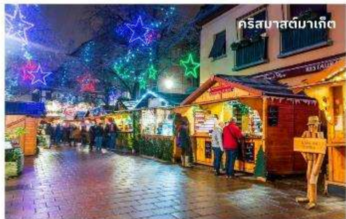
คริสต์มาสตีมาเก็ต

อิสระอาหารเย็นตามอัธยาศัย เพื่อความต่อเนื่องในการท่องเที่ยว ภายในตลาดคริสต์มาส โดยท่านสามารถ เลือกซื้ออาหารได้ภายในตลาด ถึงเวลาอันสมควร นำท่านเดินทางกลับเข้าสู่ที่พัก นำท่านเข้าสู่ที่พัก Ac Hotel by Marriott Strasbourg หรือเทียบเท่า