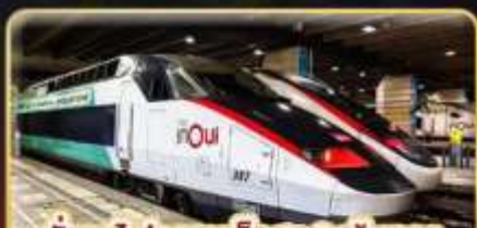
นั่งรถไฟความเร็วสูง 2 เส้นทาง PARIS - LYON & VENICE - ROME

📅 เดินทาง : 11-20 ก.พ. 68 / 15-24 มี.ค. 68 05-14 เม.ย. 68 / 29-08 พ.ค. 68