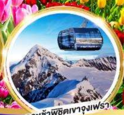
กระเช้าพิชิตเขาจุงเฟรา