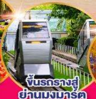
ชั้นรางสู่ ย่านมงมาร์ต