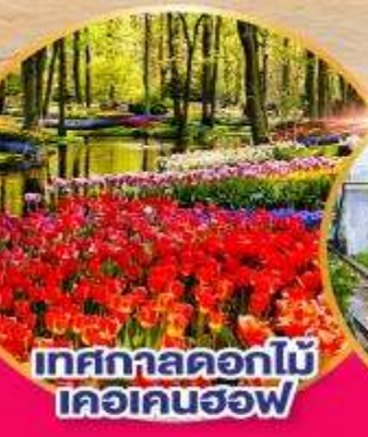
เทศกาลดอกไม้ เคอเคนฮอฟ