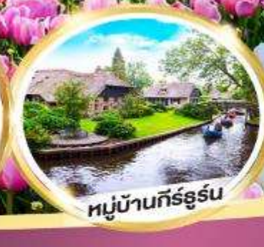
หมู่บ้านกีร์ธูร์น