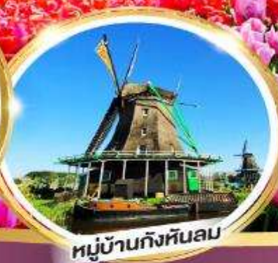
หมู่บ้านกังหันลม