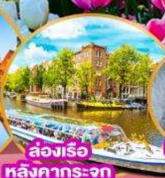
ล่องเรือ หลังคากระจุก