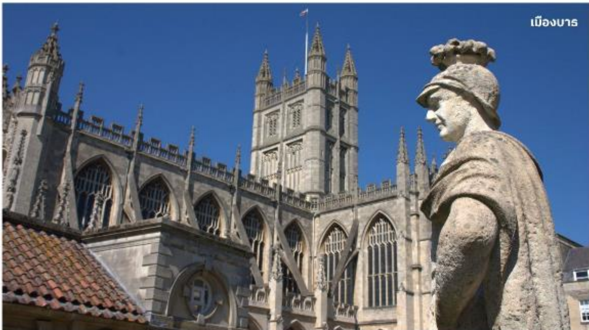
เมืองบาร

หลังจากนั้นนำท่านเดินทางสู่ เมืองบาร ดินแดนแห่งอาณาจักรโรมันอันยิ่งใหญ่บนเกาะอังกฤษเมื่อ กว่า 2,000 ปีมาแล้ว ใช้เวลาเดินทางประมาณ 1.30 ชั่วโมง นำท่านเข้าชม โรงอาบน้ำแร่โรมัน ที่ชาวโรมันมาสร้างไว้เป็นสถานที่อาบน้ำแร่โดยอาศัยน้ำจากบ่อน้ำแร่ธรรมชาติที่จะมีน้ำไหลออกมาอย่าง ต่อเนื่องถึงวันละประมาณ 1,250,000 ลิตร และมีความร้อนถึง 46 องศาเซลเซียส ที่เมืองบารมี บ่อน้ำพุ ร้อนตามธรรมชาติ 3 แห่ง บ่อนที่ใหญ่ที่สุดคือที่ ROMAN SACRED SPRING น้ำผุดจากใต้ดินลึก 3,000 เมตร มีแร่ธาตุถึงกว่า 43 ชนิด