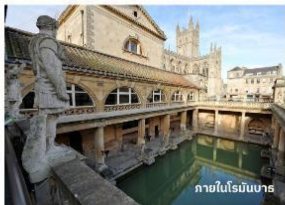
ภายในโรมันบาร