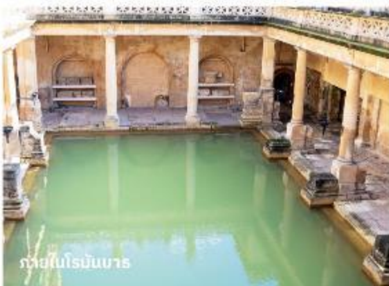
ภายในโรมันบาร