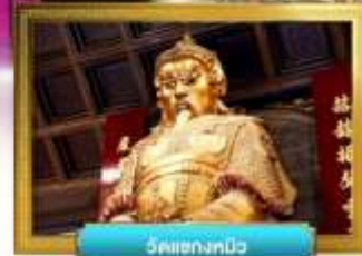
วัดเขงกตป๊อ