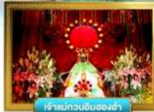
เจ้าแม่กวนอิมฮ่องซ่า