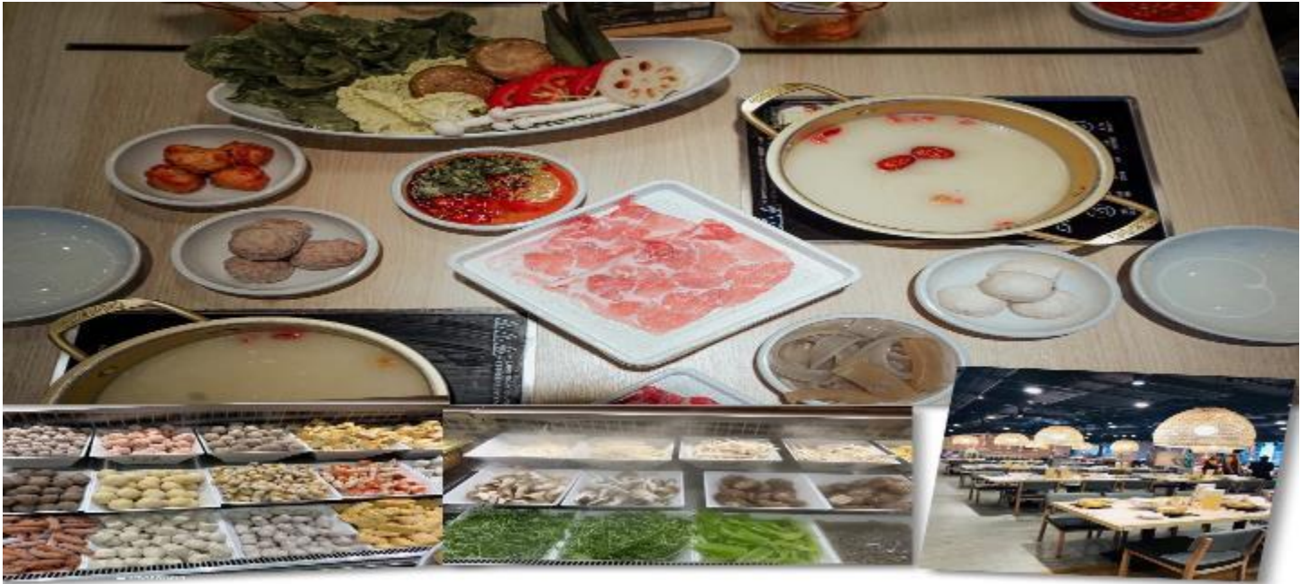
เที่ยง รับประทานอาหารเที่ยง ณ ภัตตาคาร (5) เมนูชาบู