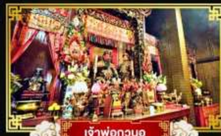
เจ้าพ่อกวนอู