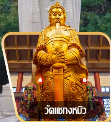
วัดเขกทงหิว