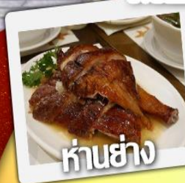
ห่านย่าง