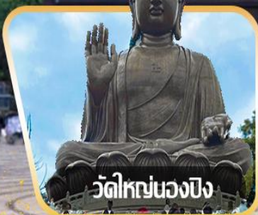
วัดใหญ่หนองปิง