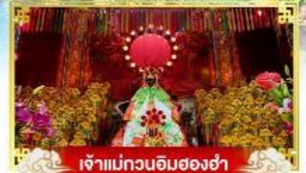
เจ้าแม่กวนอิมสองฮา