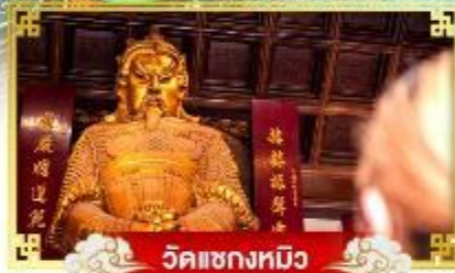
วัดเซ่งจ้งหมิว