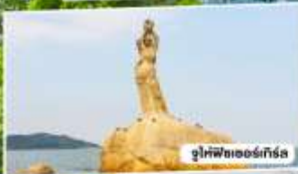
จูไห่ฟิชเชอร์รี่