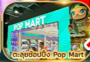
ต.สุขุมวิท Pop Mart