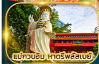
แม่กวนอิม หาดริฟลิสเบย์