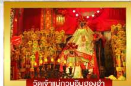
วัดเจ้าแม่กวนอิมฮองฮ่า