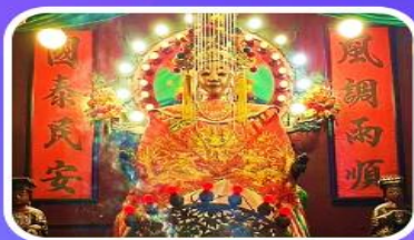
วัดเจ้าแม่กวนอิมเทียนหัว